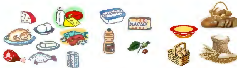
Рис.2 Какие вещества содержат продукты ?