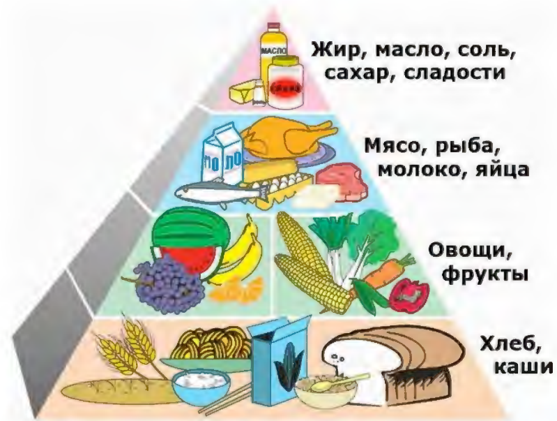
Рис.1 Пирамида питания