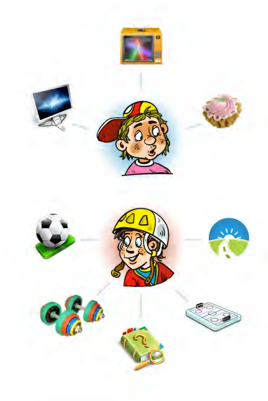
Рис.1 Что успели сделать за день Коля и Макс ?