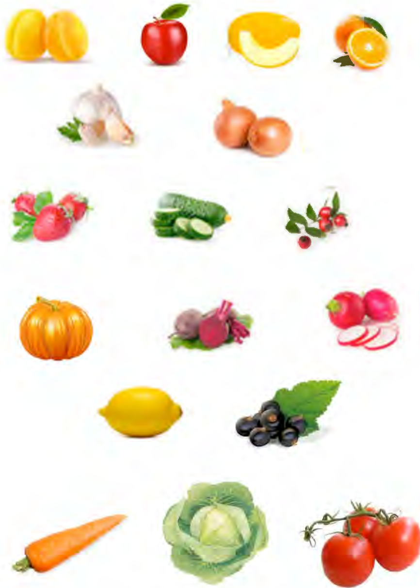
Рис.1 Какие витамины содержат овощи и фрукты?