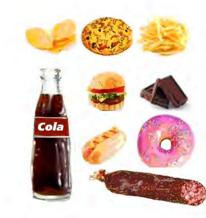
Рис.1 Вредные продукты