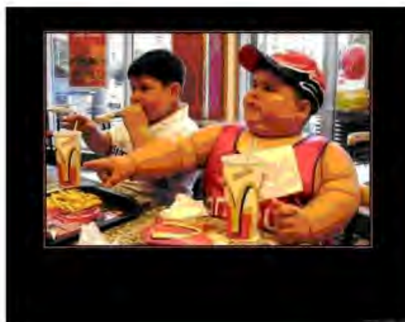
Рис.2 Ребенок, который питается гамбургерами.