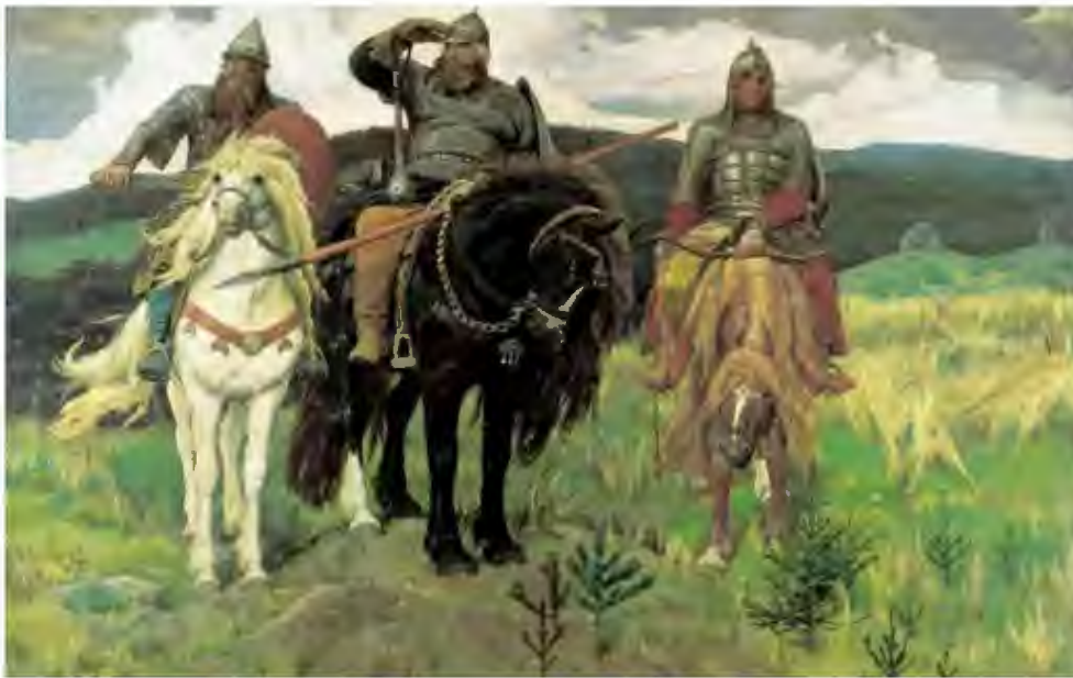
Рис.1 Репродукция картины В.Васнецова «Богатыри».