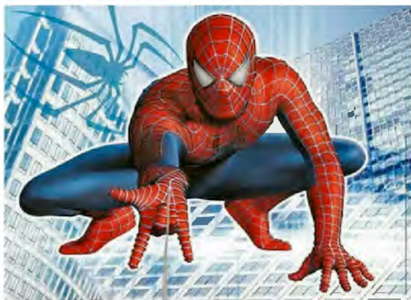
Рис.1 Человек паук